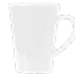
MUG307 280 / 380 ml