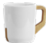
MUG923 320 ml