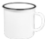
MUG802 280 ml