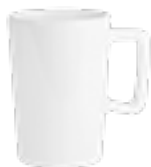
MUG315 330 ml