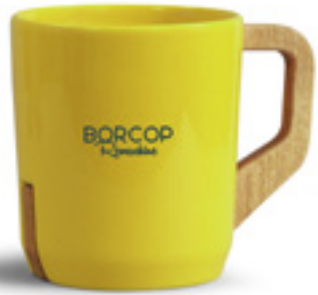
IMPRESSION DE VOTRE IDENTITÉ