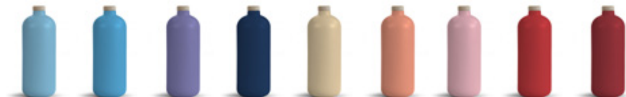
2905C 2915C 2123C 655C 155C 1625C 182C 1797C 1807C