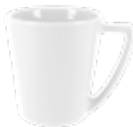
MUG205 280 / 380 ml