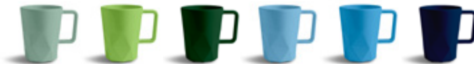
557C 367C 357C 2905C 2915C 655C