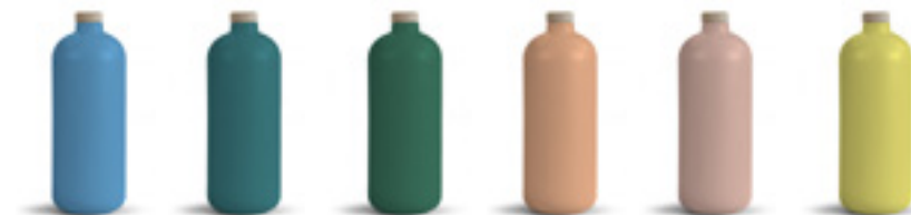
542C 7715C 2409C 1565C 2338C 100C