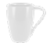
MUG210 250 / 330 ml