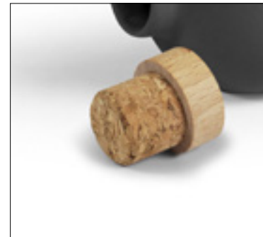
Bouteille 580 ml Céramique, bouchon en bois et liège