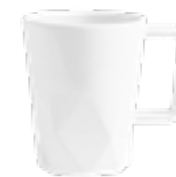
MUG933 320 ml