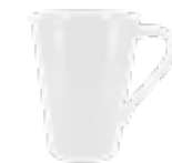
MUG309 280 / 380 ml