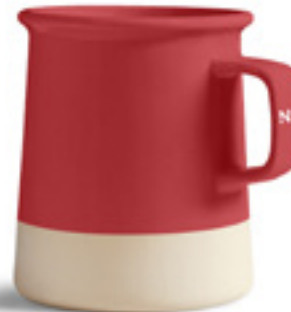
LOGO SUR ANSE