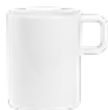
MUG901 330 ml