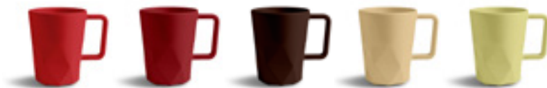
1797C 1807C 476C 155C 608C

> Couverture et bague silicone pour les nomades