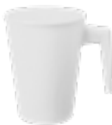
MUG212 280 / 380 ml