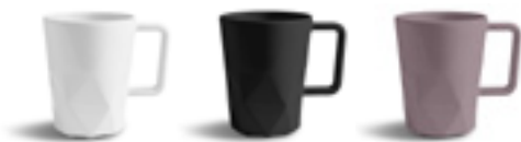
BLANC NOIR 436C