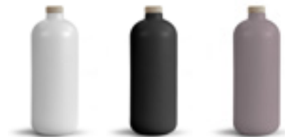
BLANC NOIR 436C