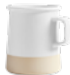
MUG930 350 ml