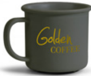
DORURE OR ET ARGENT