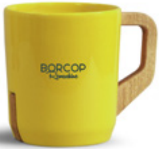
IMPRESSION DE VOTRE IDENTITÉ