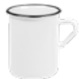
MUG900 330 ml