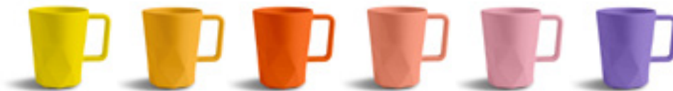
012C 1235C 1585C NOIR 1625C 2123C