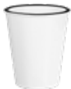
MUG319 350 ml