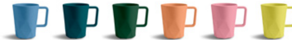
524C 7715C 2409C 1565C 2338C 100C