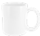
MUG313 310 ml