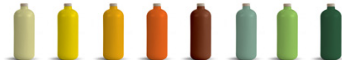
608C 012C 1235C 1585C 476C 557C 367C 357C